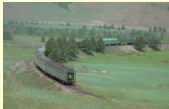
草原を駆け抜けるモンゴル鉄道。北はロシア、南は中国へ、その総延長は約2,000kmにもおよぶ。

2002年実績で見ると鉄道による貨物輸送は全体の97.8%を占め、同国の物流における鉄道輸送の重要性は非常に高い。