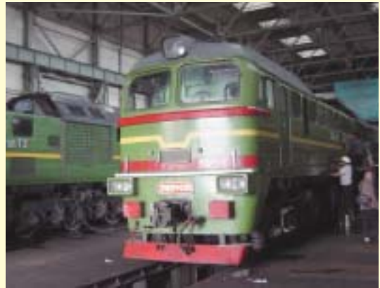
外部評価者 宮崎慶司 (OPMAC株) 現地調査 2003年6月

承諾額/実行額 80億740万円/78億9,100万円 借入契約調印 1993年11月/1995年1月 借入契約条件 金利1.0%(1)/2.6%(2)、 返済30年(うち据置10年)、一般アンタイト 貸付完了 1998年11月、2000年8月