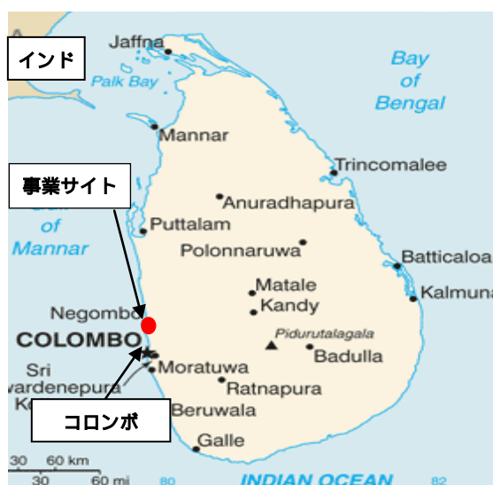
プロジェクト位置図