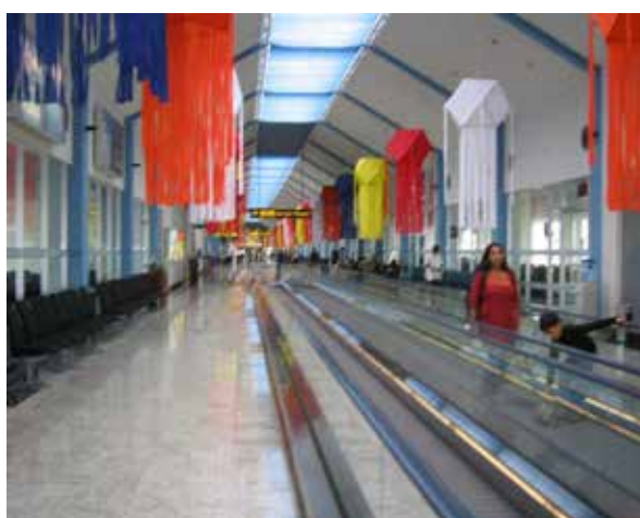
図1 建設された新旅客 (ピア 1) の搭乗口、動く歩道等