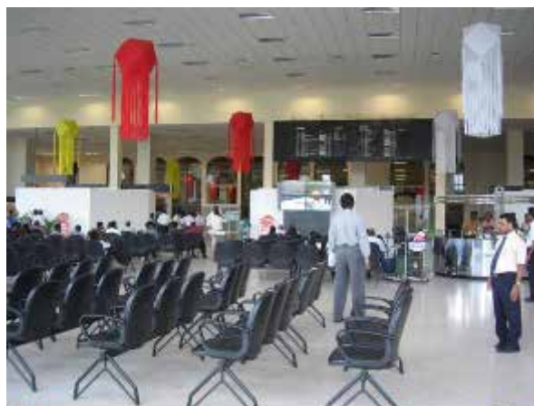
図3 改善された到着ロビー

焼却炉設備については詳細設計完了後の2001年に同国の環境基準の監督機関であるスリランカ中央環境局（CEA：Central Environmental Authority of Sri Lanka）が環境基準を変更し、定められた環境保護基準を満たす必要が生じた。 2 このため、当初設計されていた焼却炉設備の仕様では、廃棄物の処理方法や機材運用等について基準を満たすことができなくなり、この基準に合致するため、実施機関とコントラクター間で設計変更のための協議（2003年から2006年）を経て設計変更（2006年4月から12月）がなされた。評価時には設計変更に基づいた設備の設置終了し、CEA発行の環境保護ランセンスも2009年9月に取得済みであり、焼却炉設備は稼働している事を確認した。