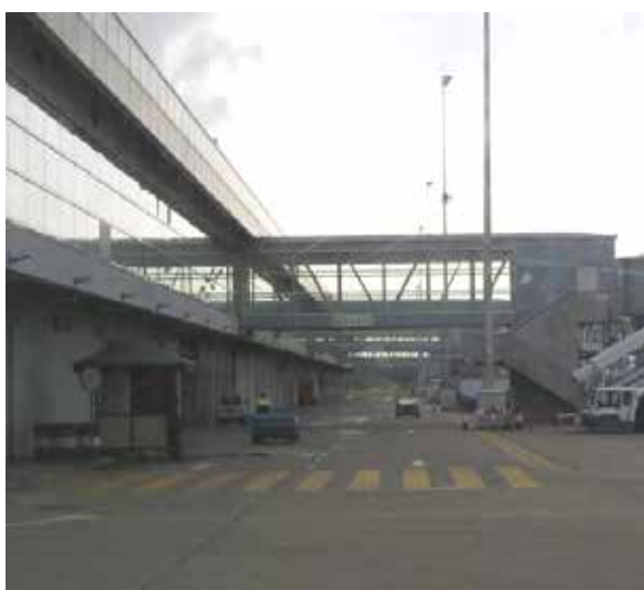
本事業により整備された新旅客ピア（ピア1）