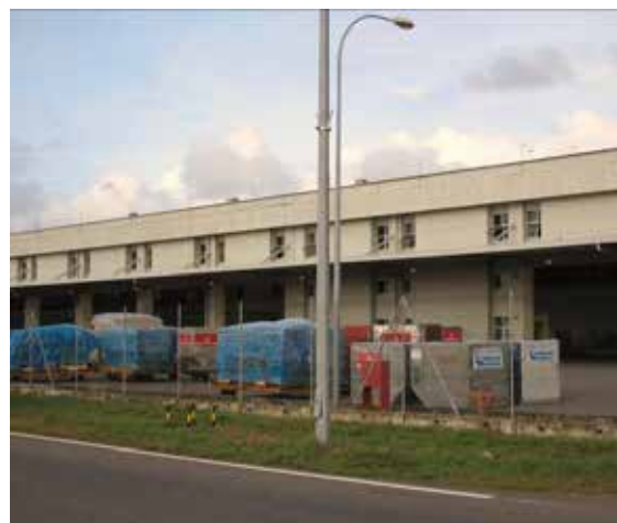
図2 建設された新貨物ターミナル