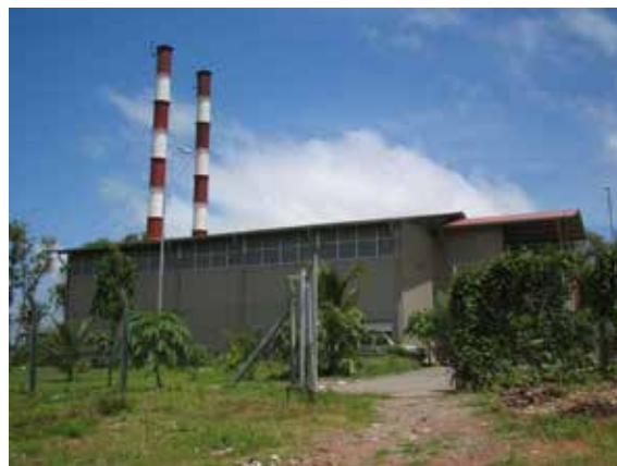
図4 改修された焼却炉設備

以上により、本事業では自然環境への影響で特に負の結果となったものはなかったと判断できる。