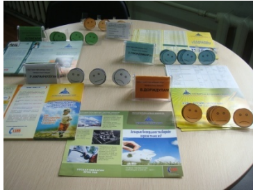
職員に対する満足度評価 (ウブルハンガイ県税務署)