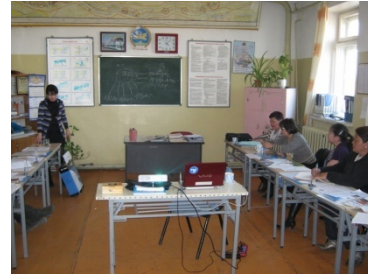
県税務署による 納税者に対する租税教育 (ダルハン・オール県)

本プロジェクトの実施により、研修機会の拡大、効率的な徴税業務、納税者サービスの向上等のプロジェクト目標は達成された。また、登録納税者の増加や、期限内収納の改善など上位目標に関しても計画通りの効果発現が見られることから、有効性・インパクトは高い。