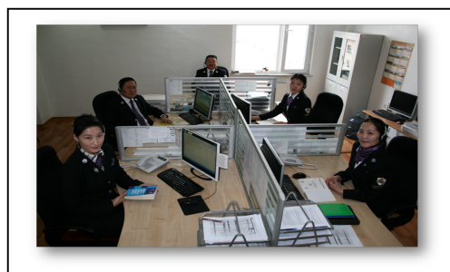
(国税庁内コールセンター)