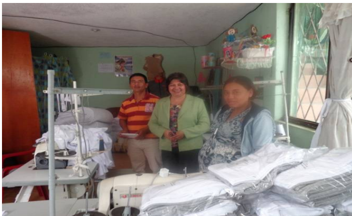
（インバブラ県イバラ市の研修センターでの受講後に学校用制服の注文を多く得るようになった女性）