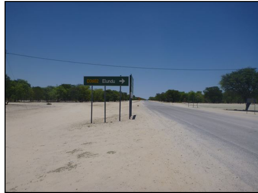
対象区間（エルンドゥ近郊）