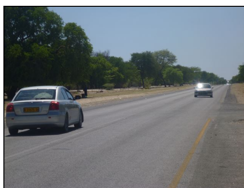
本事業で改良された道路