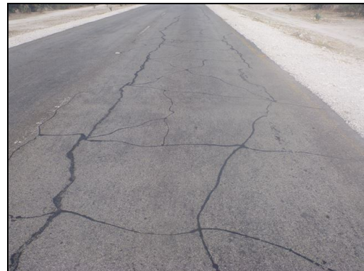
路面のひび割れ（補修後、ブンヤ近郊）

指標（International Roughness Index: IRI） 14 は平均 3.28mm/m となっており、対象区間の大半で振動が深刻なものとなる水準以下（5mm/m～）にある（表 13 を参照）。対象区間で生じているインフラの毀損は軽度のものであり、運営維持管理状況では大きな課題は発見されなかった。