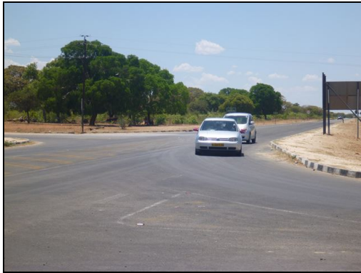
対象区間（ルンドゥ近郊）