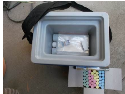
クーラーボックスの中身。保冷剤、ポリオワクチン