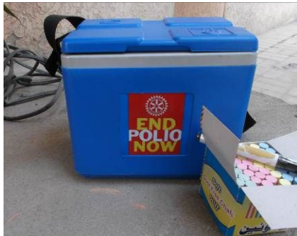
ヘルスワーカーの持ち物：ワクチン、フィンガーマーカー、チョーク

ポリオ遮断をめざしたことは適切な対応と判断される。一方、2014年のポリオ発症件数は306件のにほり、SNIDの追加実施によるポリオ遮断は実現しなかった。