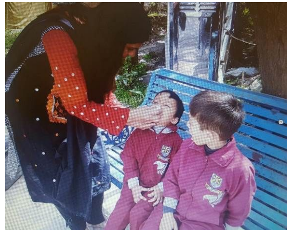
ポリオワクチンを子どもに投与する様子