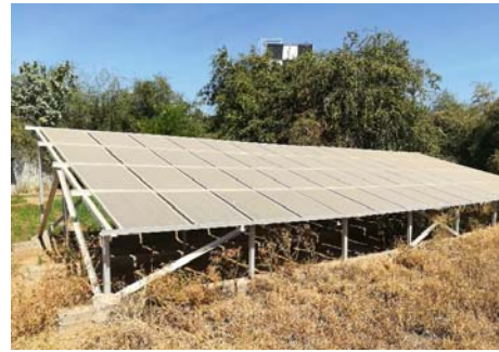
ソーラーシステムを使った地方給水（給水）