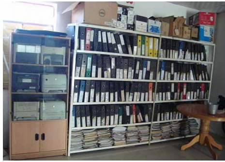
カイゼン効果：事業後に設置した資料室 (計画)