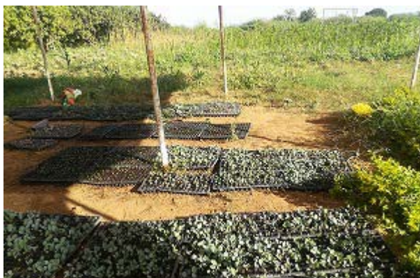
事業で導入したトレイを活用したキャベツの種苗づくり（農業クラスターの園芸地区）