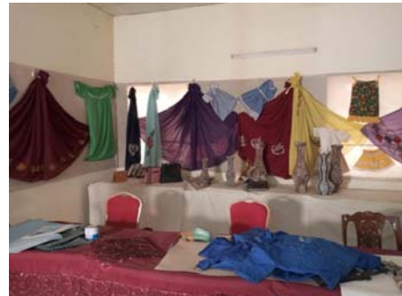
KVTC 女性コースでの成果品（職業訓練）