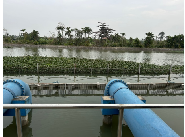
写真1: 取水河川（レ川）と本事業で整備された取水管