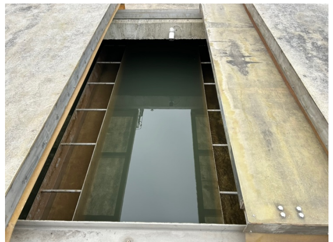
写真3：U-BCF を上から撮影