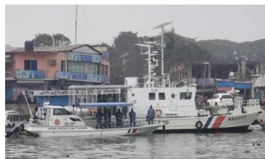
写真①：本事業で供与した20m型救助艇（奥）及び10m型救助艇（手前）