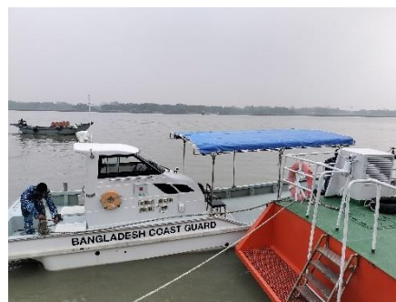
写真③：天蓋を設置した10m型救助艇