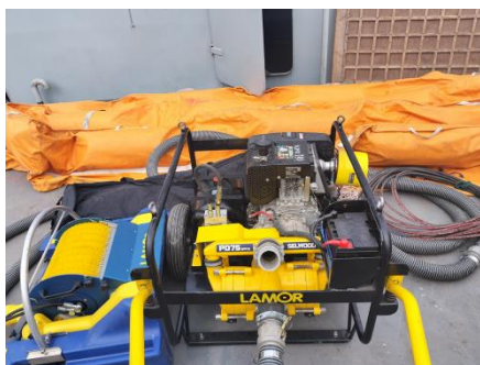
写真②：供与された油汚染防止装置

油汚染防止装置22台は、4台が予定通り20m型救助艇4隻に装備され、18台はBCGが所管する4つの管区およびBCGの職員向けトレーニングセンターであるAgrajatra Baseに配備されている。また、天蓋セットは10m型救助艇20隻にそれぞれ装備された。