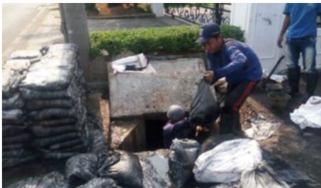
ジャカルタ市内での汚泥除去作業の様子

本案件は、インドネシアにおいて同社の下水道清掃パッケージを普及するための課題を整理し、ビジネス展開について検討するための調査です。同社の設備が普及することで環境負荷が軽減され、持続可能な水資源の利用に貢献することが期待されます。