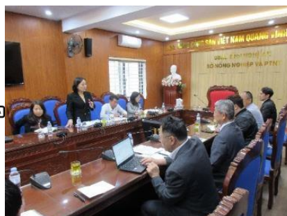
ベトナムでの会議の様子 （ゲアン省ビン市2023年9月）