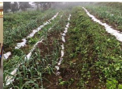
C/P 圃場で試験栽培中のニンニク （ナゴイ村第10青年団 2024年4月）