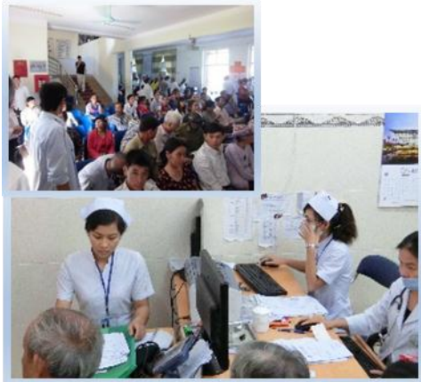
混雑する都市部の病院

国際協力機構（JICA）は、2015年2月19日テクノプロジェクト（島根県）と「ベトナム国医療の質を高める地域医療情報ネットワークシステム 普及・実証事業」に関する契約を締結しました。