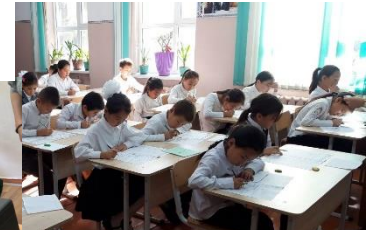
Academic Achievement Tests