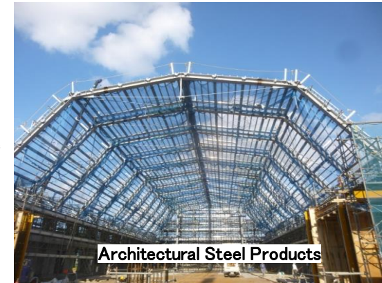
Architectural Steel Products