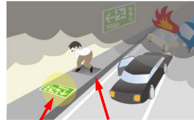
【フットライト】 【発電床®】