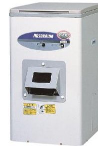
Japanese model destoner