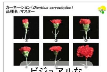
カーネーション ( Dianthus caryophyllus ) 品種名：マスター