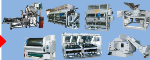
B) Steamed green tea making line by Terada Seisakusyo